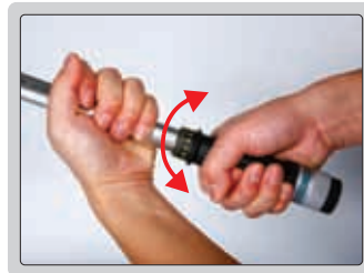
2 - Ajuste do torque