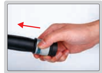
3 - Travar