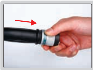
1 - Destruar