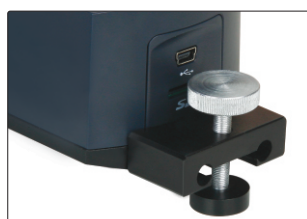
suporte para ajuste (incluso)