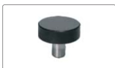
mesa plana Ø60 (inclusa)