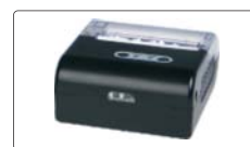
impressora wireless (opcional)