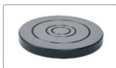
mesa plana Ø150mm (inclusa)