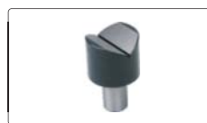
mesa prismática (inclusa)